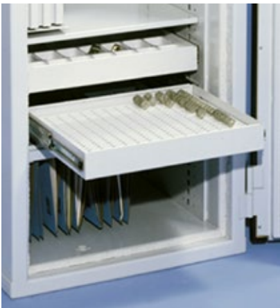
Étagère à clés coulissante