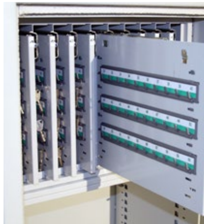
Bac à clés pour 500 clés