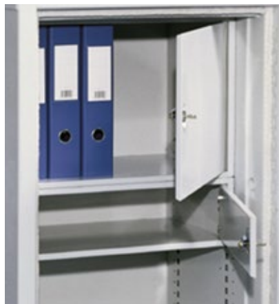
Compartment intérieur verrouillable