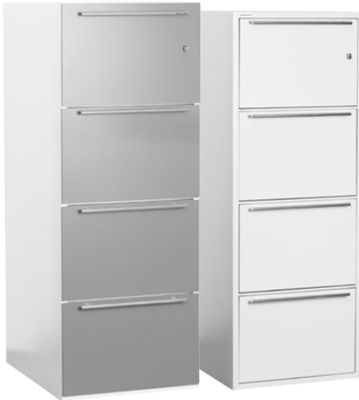
FC-40E avec quatre tiroirs, avec panneau