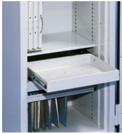
Tiroir polyvalent coulissant