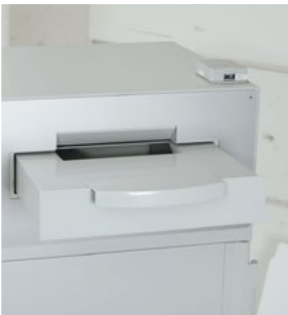
Système de dépôt testé