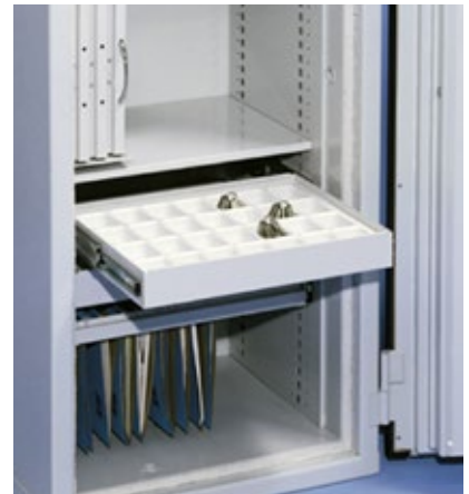
Étagère coulissante à compartiments pour clés