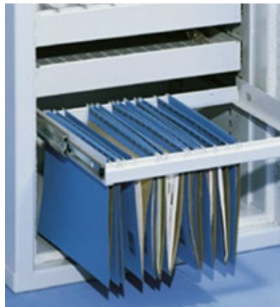
Cadre de rangement coulissant