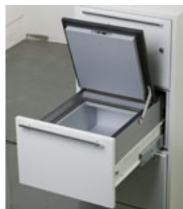
Complément multimédia verrouillable NT Fire 017 – 60 Disquette (option)