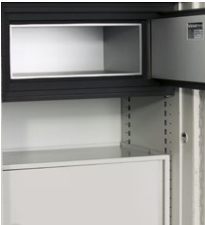
Complément multimédia MI-400